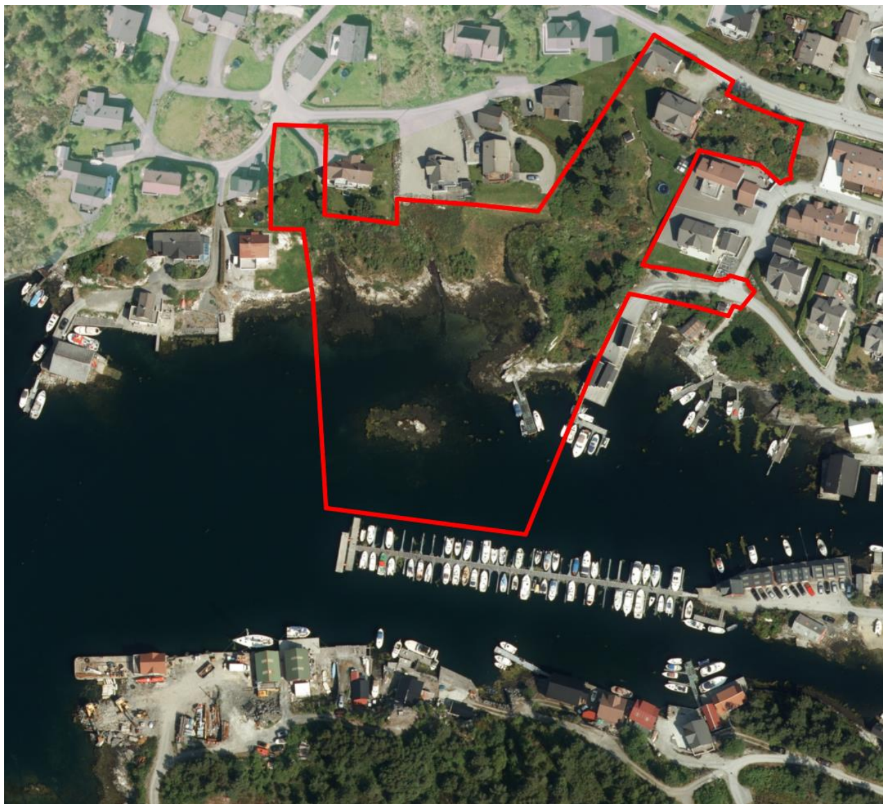
Figur 2: Kartutsnitt syner varsla planområde i raudt (iVest Consult)

Vedlegg: Kartutsnitt som syner varsla planområde