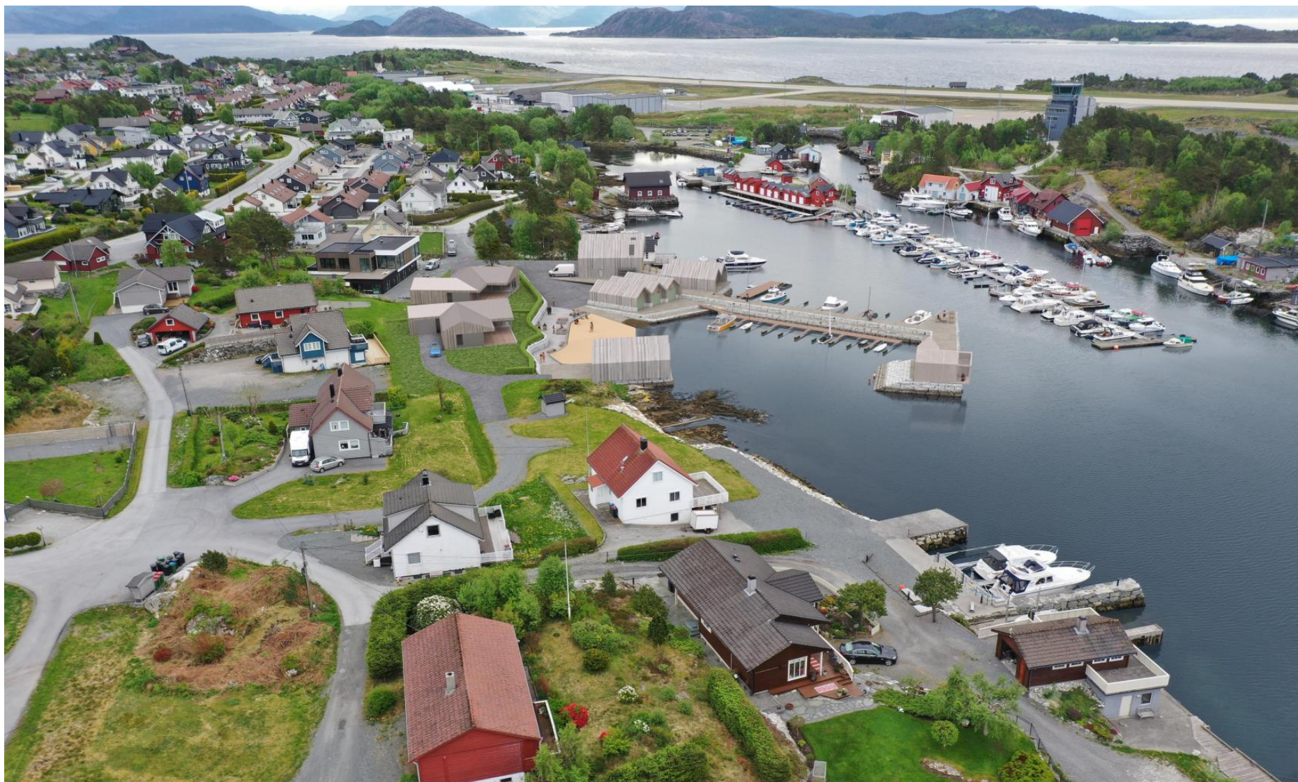
Figur 5: Illustrasjon 2 (Salt Arkitekter)

Vedlegg: Kartutsnitt som syner varsla planområde