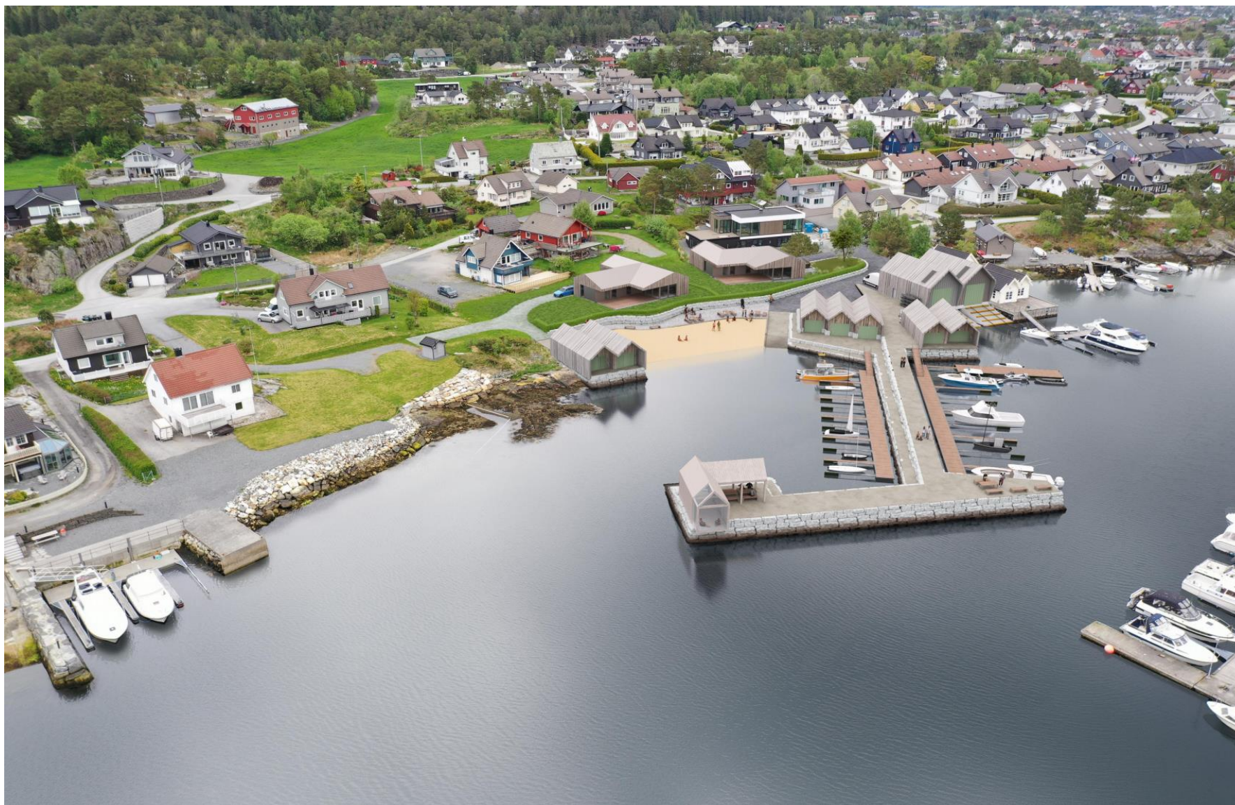
Figur 4: Illustrasjon 1 av tenkt etablert situasjon (Salt Arkitekter)

Vedlegg: Kartutsnitt som syner varsla planområde