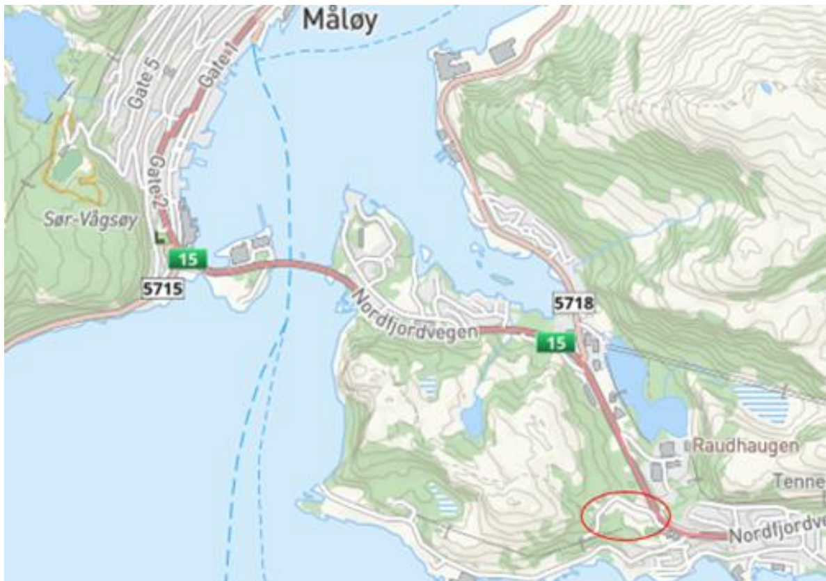
Figur 1: Oversikt over aktuelt område