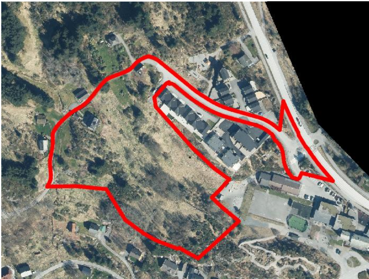
Figur 2: Planavgrensing er markert med raude linjer (iVest Consult)